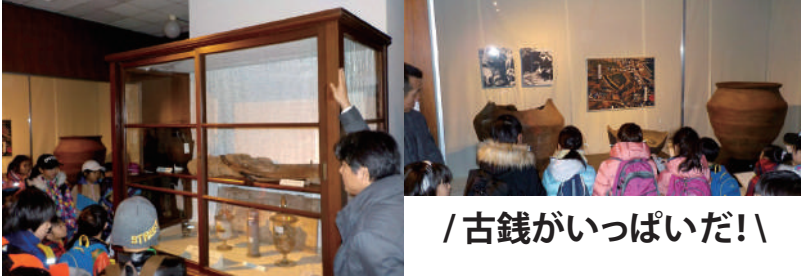
/古銭がいっぱいだ!

博物館に到着したら、まずは学芸員さんのお話を聞いて展示物を見学しました。函館博物館は歴史が古く、展示ケースそのものが文化財という珍しい展示物もあります。また、函館空港の近くで発掘された大量の古銭には参加者の皆さん興味津々。