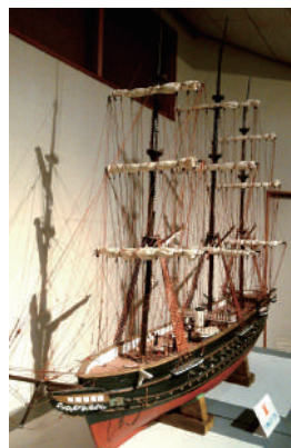
↑展示品一番人気だった開陽丸の模型。