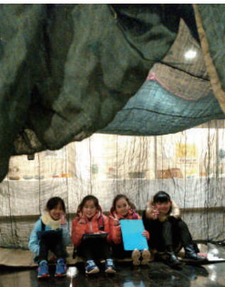
←蚊帳の中に入れる展示も。トトロにも出ていましたね。

また、この時博物館では、昭和の暮らしについての特別展示があり、昔の家電がたくさん展示してありました。ブラウン管テレビや蚊帳の他に、青函連絡船や青函博覧会などの展示もあり、大人たちには懐かしいものがいっぱい。ダイヤル式の黒電話など、今は見ることのない家庭のアイテムに、子どもたちは面白そうに展示物を見学していました。