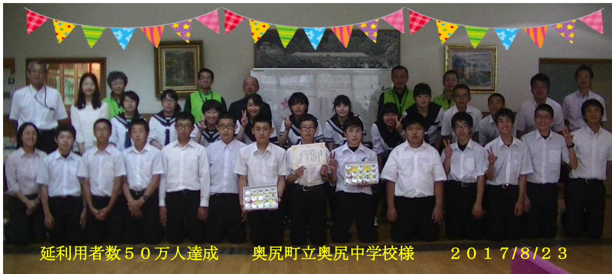
延利用者数50万人達成