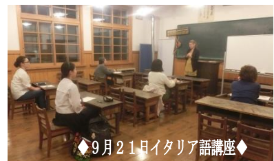
◇9月21日イタリア語講座◇