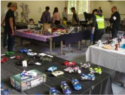
第12回函館プラモ展示会 in ふるる函館 2018年6月2日(土)3日(日)