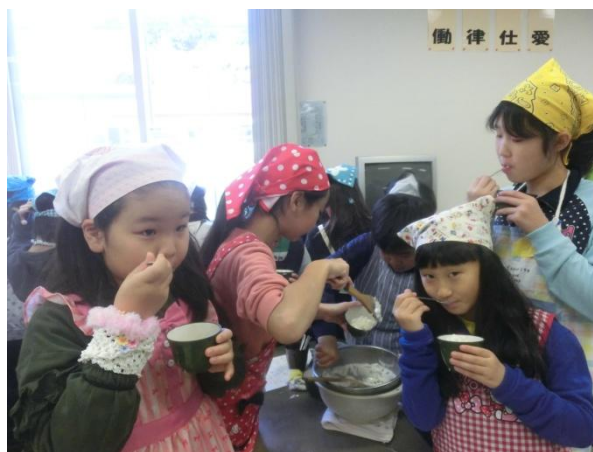
「アイスクリーム作り」ちょっとひと足先に味見です。自分たちで作ったアイスがこんなに美味しいなんて！😊